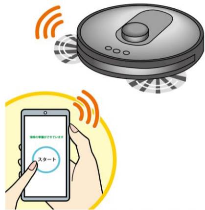
スマホと連動できるタイプなら、お出かけ中でもスマホからスタート！

て以上の家でも各階に持ち運べば掃除してくれるので、掃除の時間を軽減することが出来ます。 ・掃除範囲によって機種を選べる…コンパクトな部屋を掃除するなら、一般的なタイプで十分。複数の部屋を掃除する場合は、部屋の間取りを認識できる内蔵のセンサーがついたタイプがおすすです。 ・拭き掃除ができるタイプも…ゴミを吸い込んだ後に拭き上げるため、雑巾がけの手間が省けます。