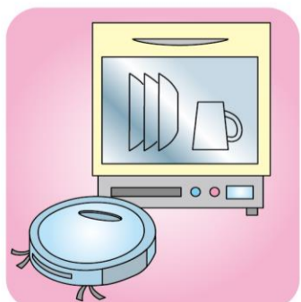
家電のレンタルサービスが広がっています。大手家電メーカーではサブスクも。興味があれば、短期間だけ試してみるのも良いですね！