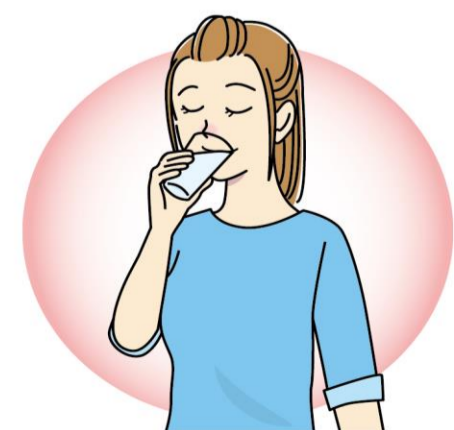
脱水を防ぐため、入浴前後には必ず水分補給をしましょう！

湯船に入るのがどうしても面倒！という場合は、大きめの洗面器などにくるぶしが浸かる程度までお湯をためて足湯をしながらシャワーを浴びると良いですよ。シャワーだけよりも温熱効果が上がって、疲れが取れやすくなるそうです。