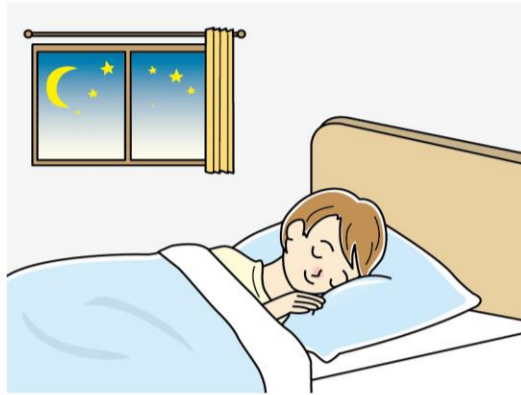
湯船に浸かると、深部体温を上げることができ、入浴後に深部体温がしっかりと下がることで、スムーズな入眠をサポートしてくれます。

冷房の効いた空間にいて、なかなか汗をかけない環境でも、湯船に浸かれば汗をかくことができ、体温調整に役立ち、熱中症のリスク回避に役立ちます。